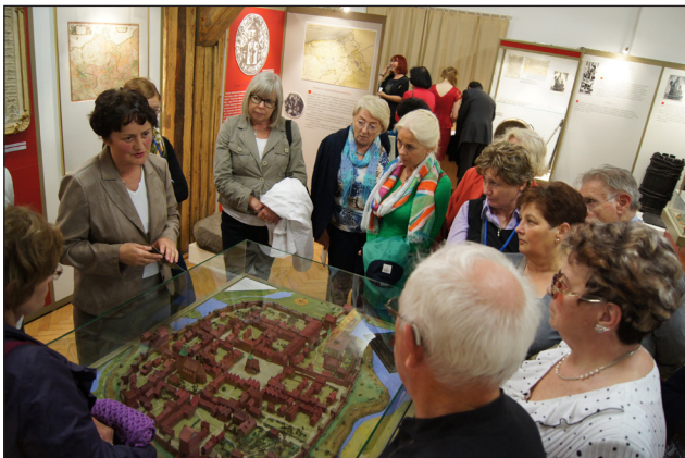
Uczestnicy Forum odwiedzili Muzeum Państwowe w Koszalinie.

W dniach 12-15 września 2013 r. w Centrum Luterzańskim w Koszalinie odbyło się XIX Forum Ewangelickie o temacie przewodnim: „Przyszłość Kościoła – Kościół przyszłości”. Jego uczestnicy dyskutowali o roli kobiet, mężczyzn, duchownych, świeckich i mediów w Kościele przyszłości.